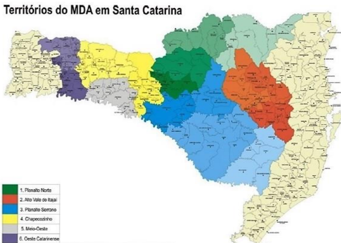
FIGURA 01: Territórios Rurais do MDA em Santa Catarina

“pertencimento” histórico-cultural, além da gestão social e do controle sobre as políticas públicas pelos atores territoriais e sociedade civil organizada.