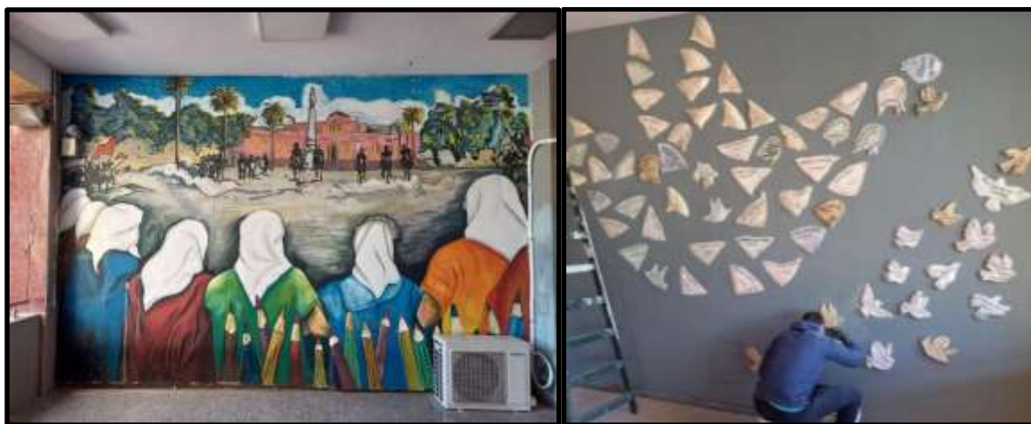
Figura 3. Murales como patrimonio cultural en la Universidad Nacional de La Pampa (UNLPam).