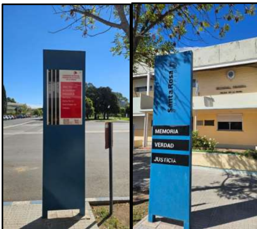
Figura 4. Comisaría Seccional Primera y Unidad Regional, ex Centro Clandestino de Detención y Tortura, Santa Rosa (La Pampa).