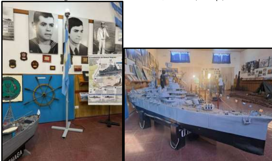
Figura 6. Centro de Veteranos de Guerra, Santa Rosa (La Pampa).