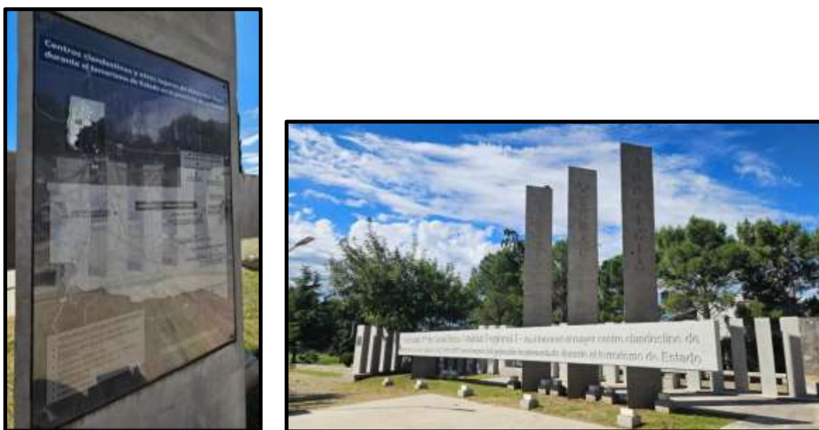
Figura 1. Parque Provincial de la Memoria. Inaugurado en Santa Rosa (La Pampa) en el año 2023 que se encuentra integrado a la Red de Sitios de Memoria.