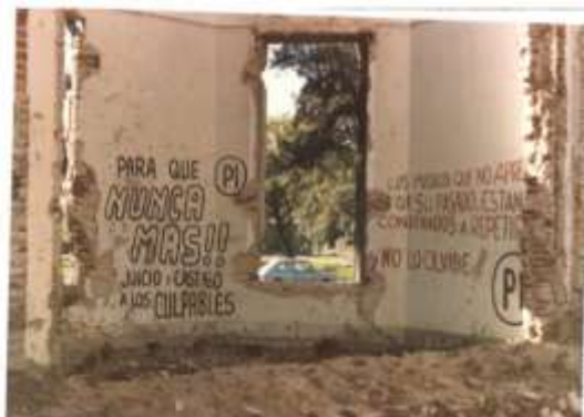
Figura 5. Paredes en pie con grafitis tomada en el año 1985.