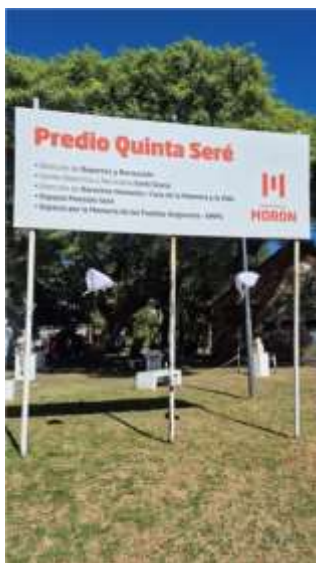
Figura 7. Entrada al predio Quinta Seré.