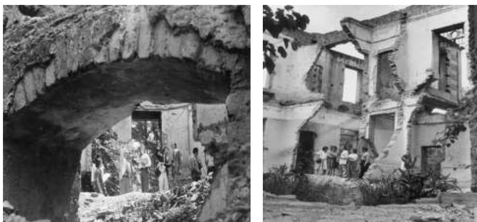
Fuente: Archivo de la DD.HH. de Morón. Imágen N°1 - (b) Fuente: Archivo de la DD.HH. de Morón. Imágen N°2.

En ese contexto, el estudio del espacio en su marcación social involucra relatos e historias de los actores que establecen ciertas vivencias en relación con el ámbito de análisis (San Julián, 2014), o las tramas entre actores que participan del proceso de recuperación (Croccia, Guglielmucci y Mendizabal, 2008). En esa dirección, pesa sobre este ámbito barrial, el alcance de las estrategias de disciplinamiento de la actuación de las Fuerzas Armadas y las huellas que dejó su accionar en las tramas del ámbito cotidiano de los vecinos cercanos al predio. Las ruinas de la casona aún en pie permanecieron como testigo silencioso de las prácticas atroces del terrorismo de Estado. El paso del tiempo y la depredación del sitio deterioraron progresivamente las estructuras materiales de la Mansión (Proyecto Mansión Seré, 2006). En este periodo los vecinos le dieron al sitio un uso no formal utilizándolo como un espacio recreativo, de paso, transitorio, espontáneo y ocasional y elaboraron prácticas vecinales diversas 3 . El predio abandonado condensó modos de significación y elaboró imaginarios urbanos (Lindón, 2007). Como una suerte de estratificación geológica, estas primeras sedimentaciones de la memoria, son entendidas como lo anterior, lo que antecede al proceso de las políticas públicas de la memoria según las entendemos y pensamos hoy en día (Quignard, 2016).