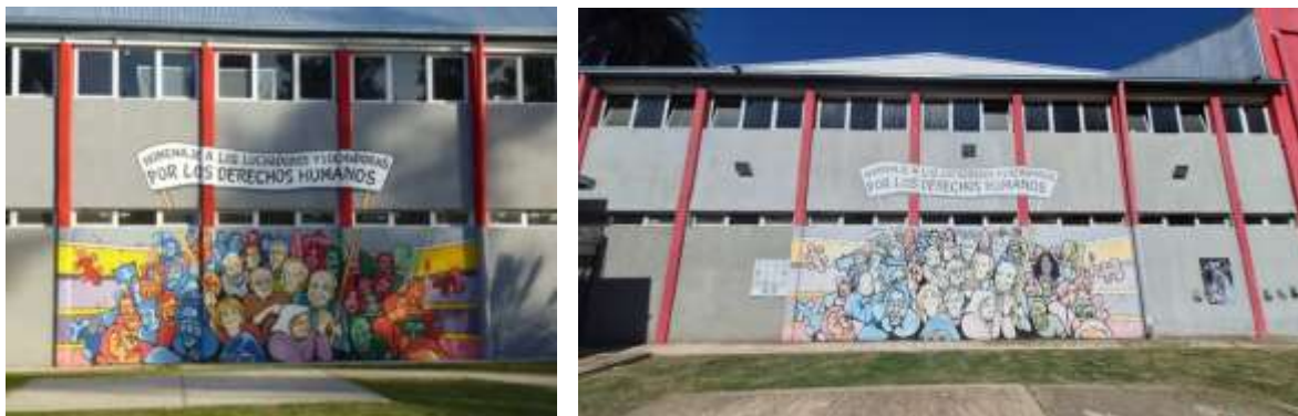
Figura 10 a y b. Fotografía del mural sobre pared lateral del microestadio municipal en dos tiempos.

a)