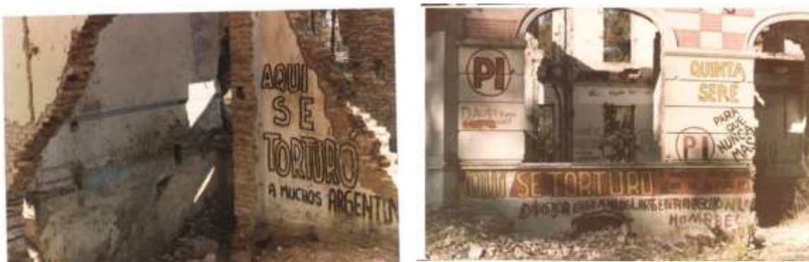
Figura 4 a y b. Grafitis en pared de la Mansión Seré. Puede verse el sótano atrás, tomada en el año 1984.