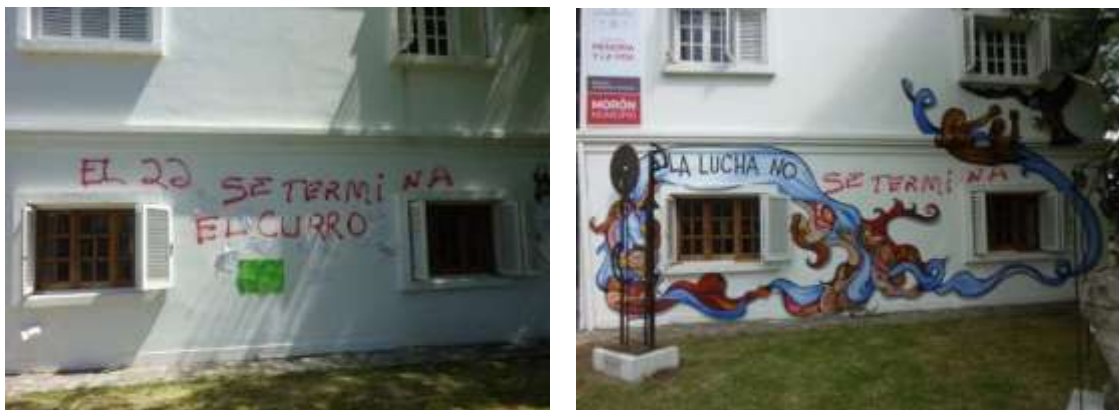
Figura 8 a y b. Detalles de carteles en las paredes de la institución colocadas durante el abrazo simbólico y el mural colectivo inaugurado el 5 de diciembre de 2015.