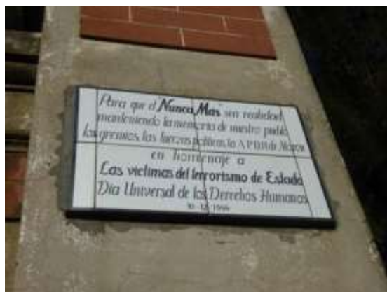
Figura 3. Placa conmemorativa en los pilares de entrada de la antigua Mansión Seré. La casona ya había sido demolida.