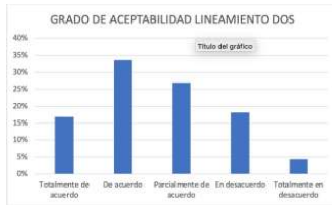
Figura 2. Percepción lineamiento Dos

Al respecto encontramos que el 78% de los encuestados están total o parcialmente de acuerdo con la propuesta. Esto indica que existe un consenso casi absoluto sobre la necesidad de un diseño curricular. No obstante, el 22% indica que algunos miembros de la comunidad educativa no ven la necesidad de este tipo de diseño curricular.