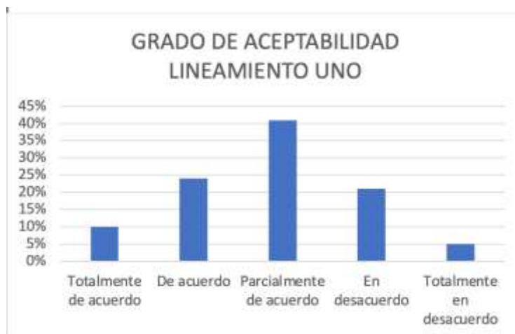
Figura 1. Percepción lineamiento uno