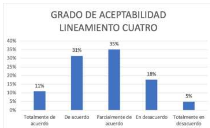
Figura 4. Percepción lineamiento Cuatro

Por otro lado, encontramos que una minoría 23% está en desacuerdo o totalmente en desacuerdo con la propuesta. Esto sugiere que hay algunas personas que no creen que la universidad tenga la responsabilidad de proporcionar condiciones institucionales para el cumplimiento de sus funciones o para el bienestar de su comunidad.