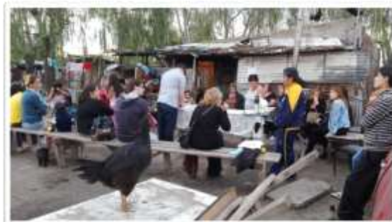
Figura 14. MTP n° 19 Puente de Fierro Territorio Posible, 23 de febrero de 2018 en el Centro de Apoyo Escolar Rincón de Luz de Zulema Díaz