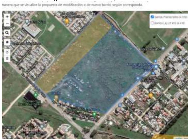
Figura 3. Chacra de Bosque Grande