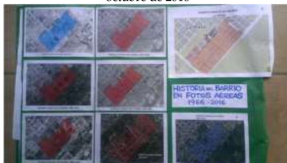
Figura 11. Puente de Fierro, la historia del barrio en fotos aéreas, en uno de los afiches de la Primera MTP en octubre de 2016