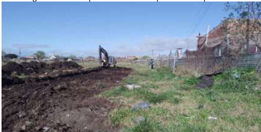
Figura 8. Primera apertura de calles del predio de Bosque Grande

Todo lo anterior, se solapaba con las MTP que iban dando forma al “barrio que queremos”, pero también a la primera concreción de una imperiosa necesidad: la apertura de calles (Figura 8).