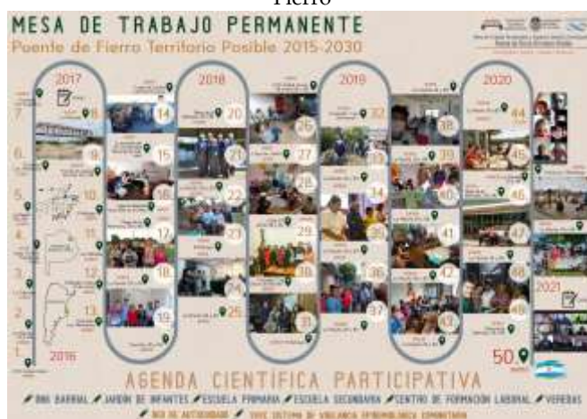
Figura 15. Banner de las primeras cincuenta Mesas de Trabajo Permanente realizadas en el barrio Puente de Fierro