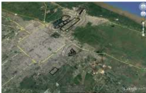
Figura 10. Áreas objeto de intervención y transformación del PIO UNLP-CONICET (2014-2016) “Estrategias para la Gestión Integral del Territorio en el Gran la Plata”: 1) ACP Agenda Científica Participativa “Territorio, Industria y Ambiente” (al norte), 52 MTP realizadas hasta Octubre 2023, 2) ACP “Intersticios Urbanos” (aún no ejecutada, al centro), y 3) ACP Barrios Populares “Puente de Fierro Territorio Posible” (al sur), 59 MTP hasta Octubre 2023.

Fuente: PIO UNLP-CONICET, elaboración propia con base en Google Earth G.Cirio.