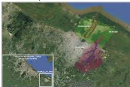
Figura 9.: PIO UNLP-CONICET (2014-2016) “Estrategias para la Gestión Integral del Territorio. Casos en el Gran la Plata al Sureste de la Región Metropolitana de Buenos Aires. Áreas objeto de estudio: cuenca de los Arroyos Maldonado (color morado) y Zoológico, los Canales del Puerto y sus áreas de influencia, en tonos verde (Partidos de La Plata, Ensenada y Berisso, Buenos Aires, Argentina).