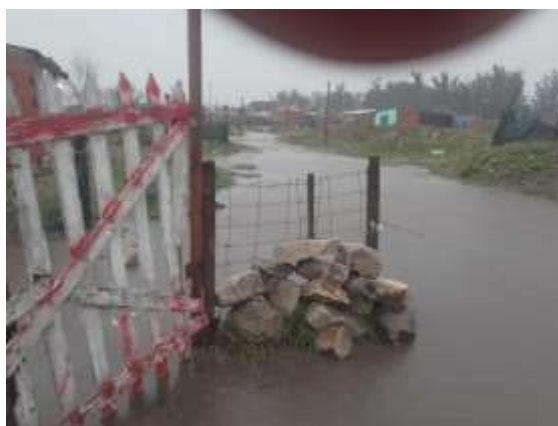
Figura 17: Bosque Grande

Cuando la gestión pública, la planificación y el ordenamiento territorial tradicionales hacen agua (Figuras 17 y 18) los hechos generados por las MTP les ganan a las palabras y la burocracia. La ciencia crítica, popular y transformadora está, a través de las ACP, interpelando a la gestión y planificación tradicionales.