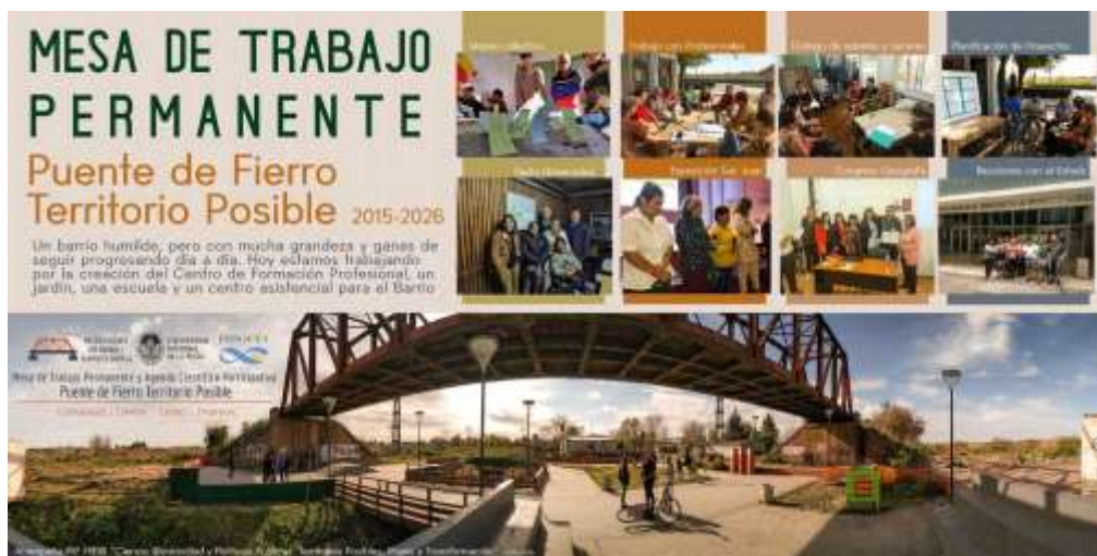
Figura 2: “Mesa de Trabajo Permanente Puente de Fierro Territorio Posible 2015-2026”.