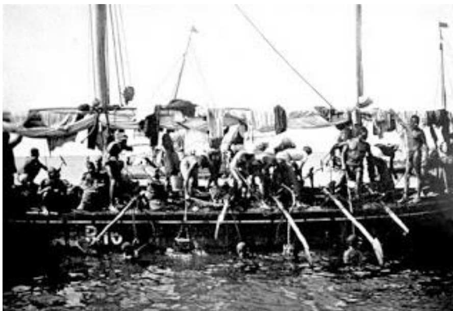
Figura 4. Pescadores de perlas en la costa arábica