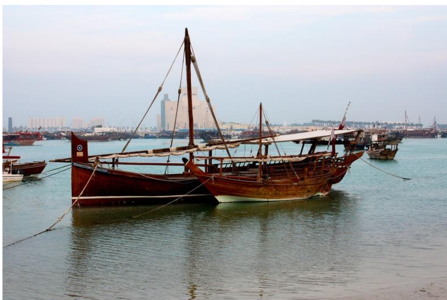
Figura 3. Dhows kuwaitíes pescadores de perlas