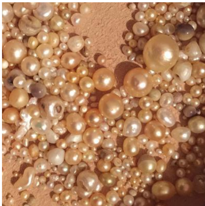
Figura 2. Perlas naturales de Kuwait